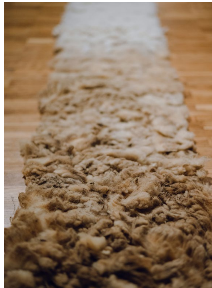
MARINA RAJŠIĆ / Rasplet vuna, 300 x 40 cm, 2023.