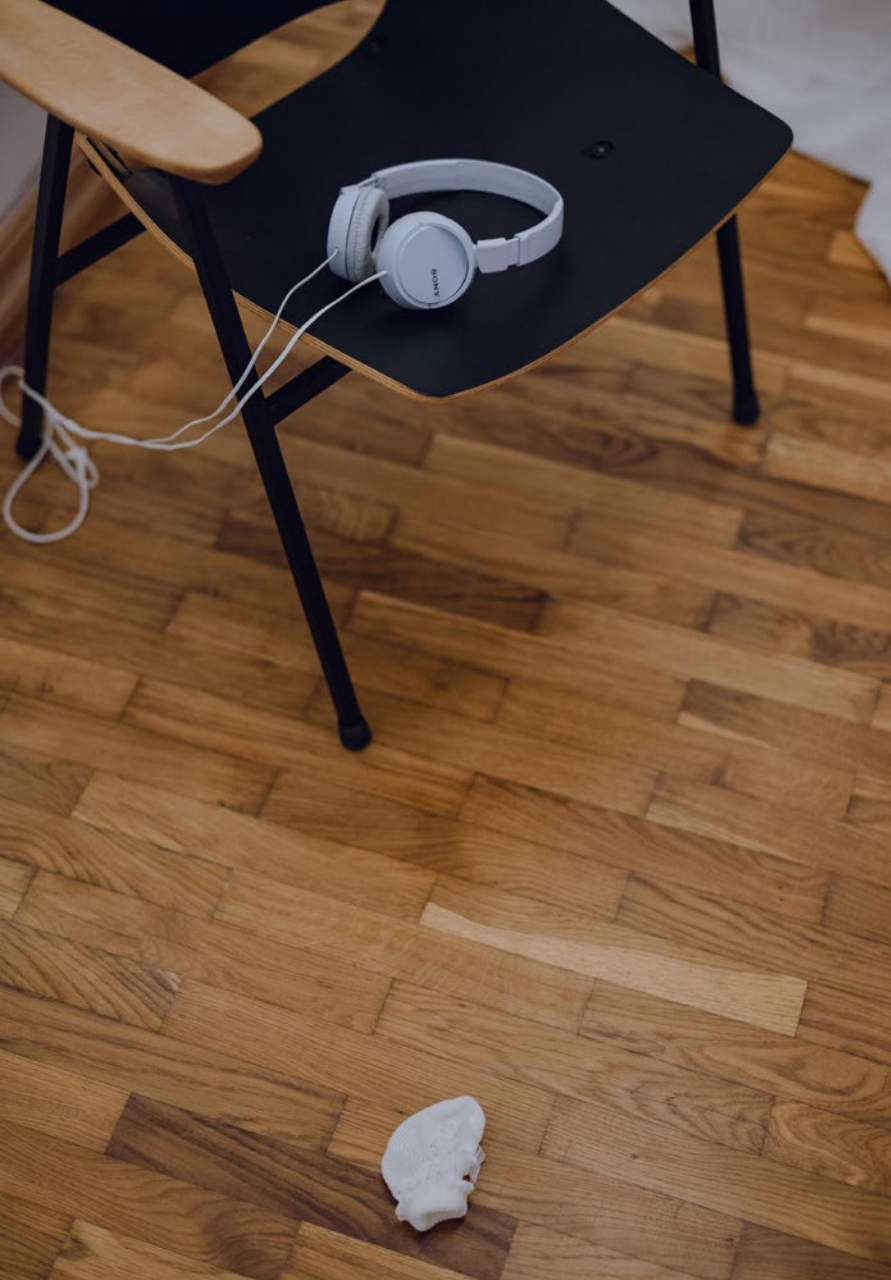
MERI FILES / White noise audio, 15 min, 2023.