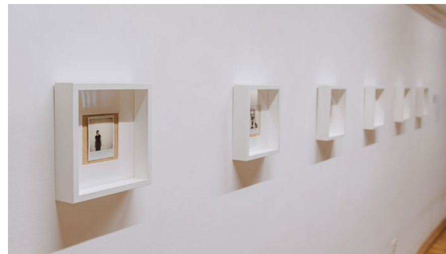
SANDA ČRNELEČ / Rudnik – rudar polaroid fotografije, 2023.