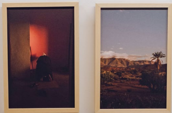
GLORIJA BLAZINŠEK / Marocco: suoni e colori / iz ciklusa fotografija tisak Hahnemuhle Cezanne Canvas 430 gr; audio 4:43 min, 2022.