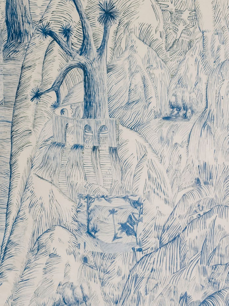
ALBA MIOČEV / Bez naziva / akril na platnu, 2023.