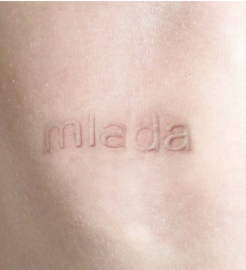
Maja Rožman / UPISANO slijepi tisak na koži, dokumentarna fotografija, 2023.