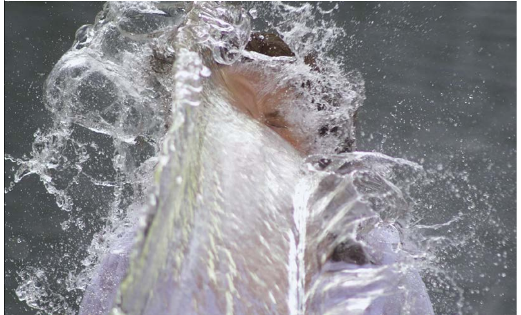
Letricija Linardić / STILL STANDING video instalacija, 2023.