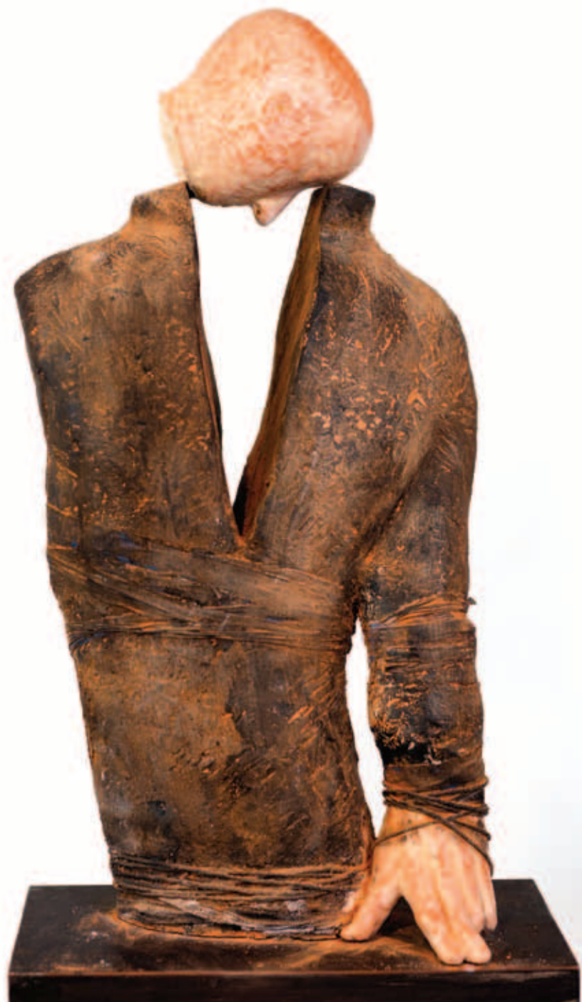
U škripcu, 2022. 88 x 40 x 19 cm