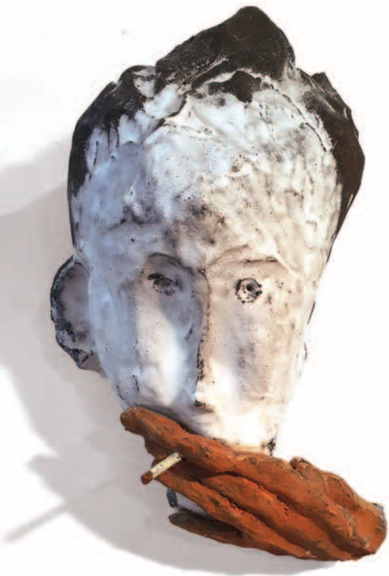
Iz serije Šibenik – Pušaći 2016. – 2019.