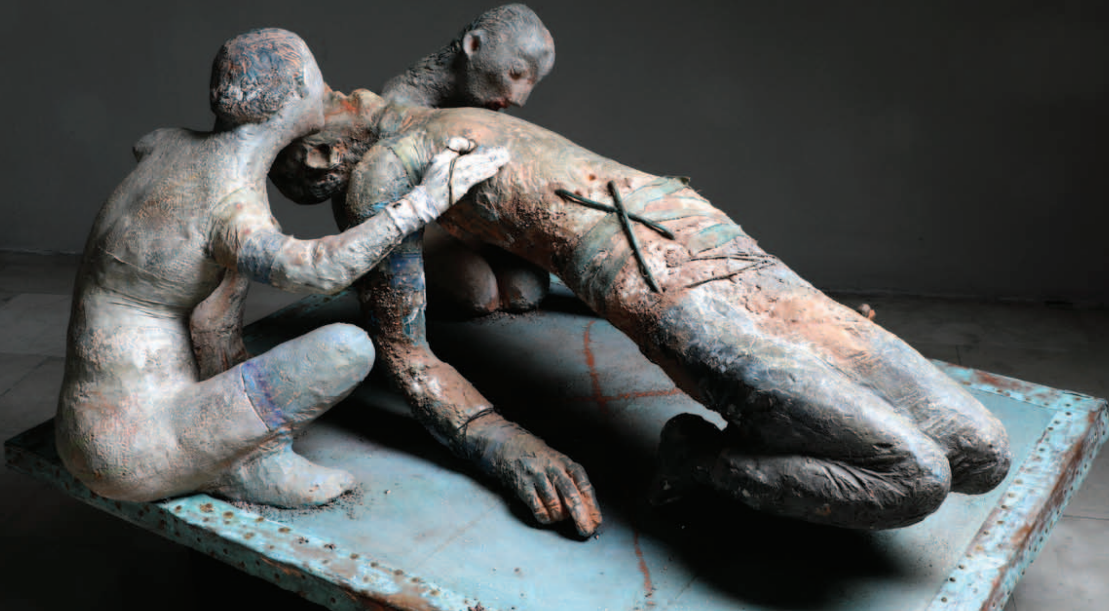
Umirući junak kojeg ljube vrele usne žene, 2019. 82 x 118 x 88 cm