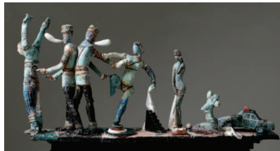
Hapšenje Andrije Terpentina, 2019., 74 x 132 x 28 cm