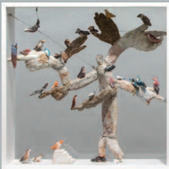
Autoportret s pticama, 2013./14. 70 x 70 x 20 cm