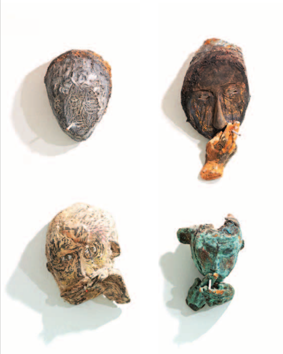
Iz serije Šibenik – Pušaći, 2016. – 2019.