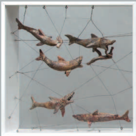
Autoportret s ajkulama, 2013./14. 70 x 70 x 20 cm