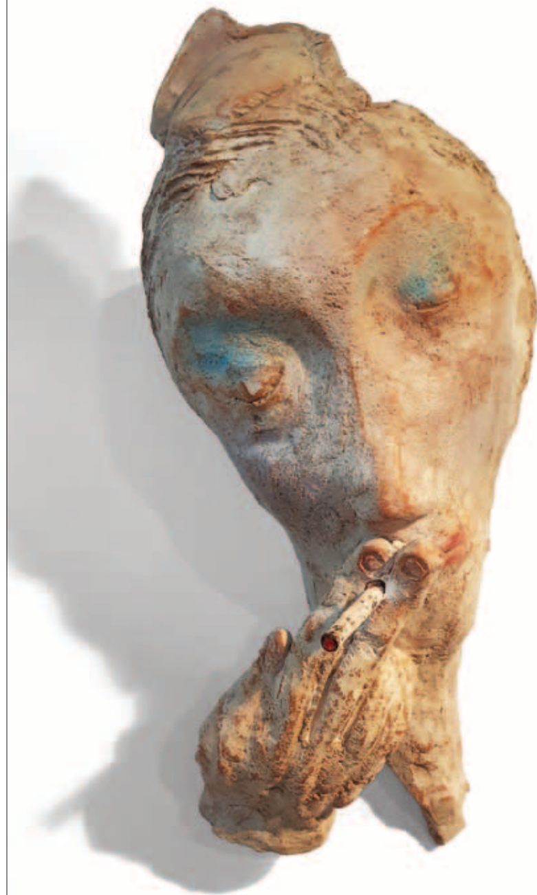
Iz serije Šibenik – Pušaći 2016. – 2019.