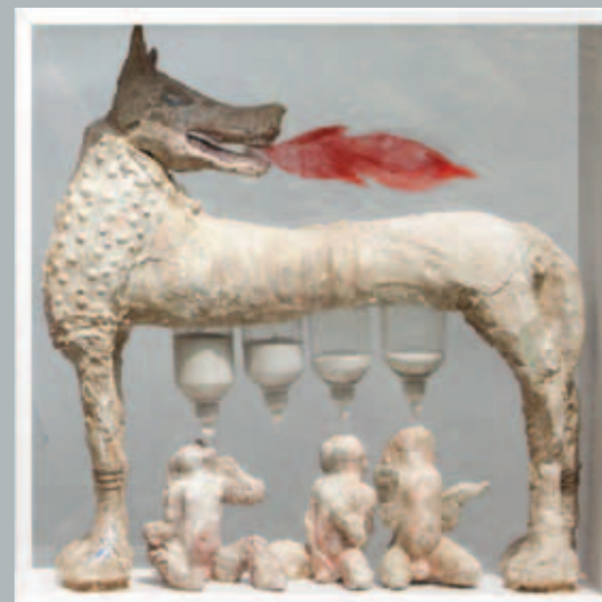
Autoportret s Romulom i Remom, 2013./14. 70 x 70 x 20 cm